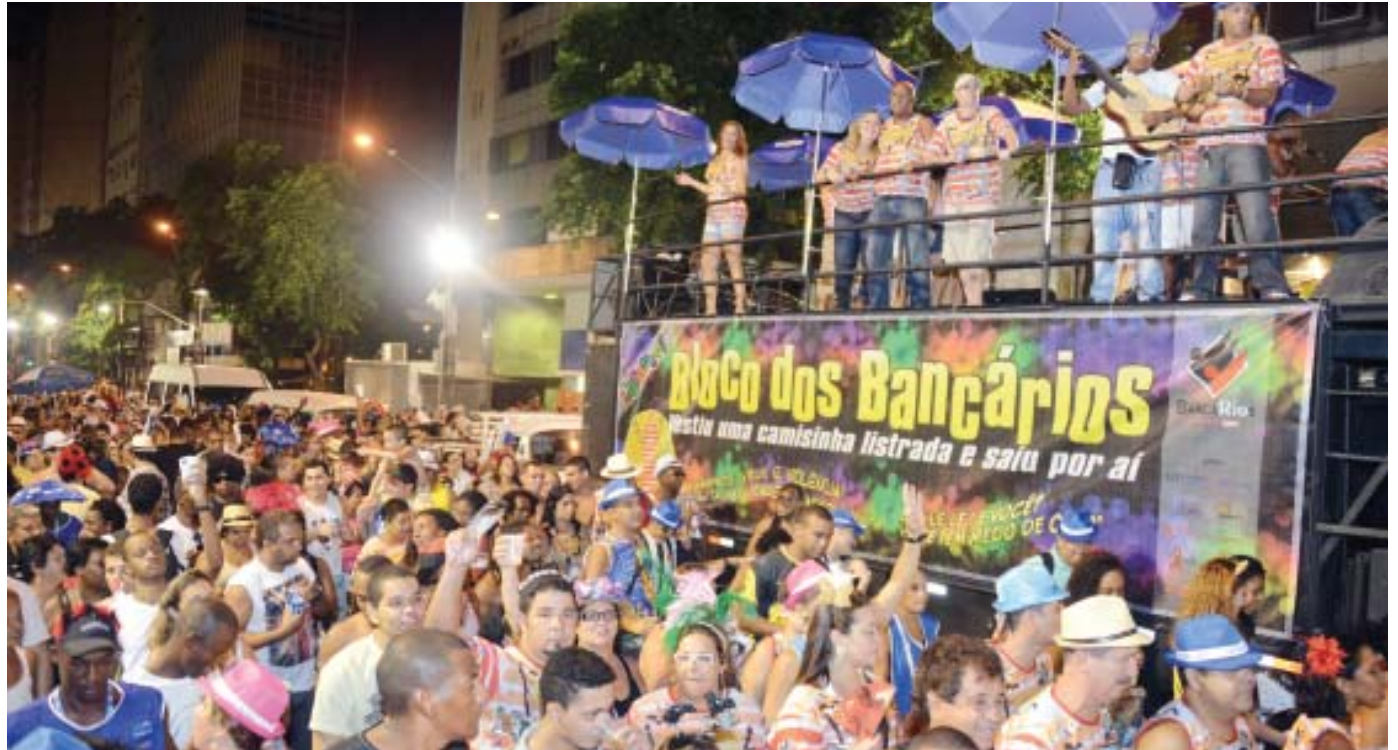
Mais de 8 mil pessoas brincaram no Bloco dos Bancários, na sexta-feira de carnaval, na Avenida Rio Branco

A cada ano o Bloco dos Bancários fica melhor e mais animado. Na última sexta-feira (8) de carnaval, a agremiação deu um show e arrastou mais de 8 mil foliões no desfile na Avenida Rio Bran-